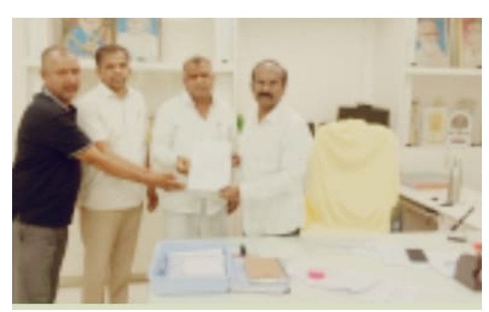
పద్మక్రాంతి, మే 30, కీసర: