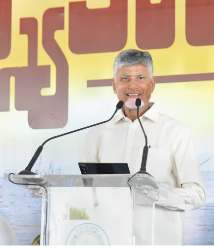
అందించాం. ఇవాళ 1,30,796 కుటుంబాలకు రూ.262 కోట్ల అద్దక సాయం అందించాం. 2014-19లో మత్స్యసంపద ఉత్పత్తి 19.18శాతం పెరిగింది. కానీ, వైకాపా హయాంలో నాలుగు రెట్లు పడిపోయింది. వ్యవసాయం, నిర్మాణ రంగం తక్కువ.. మత్స్య సంపదనే ఎక్కువ మంది ఆధారపడ్డారు. దేశంలో రొయ్యల ఉత్పత్తిలో 80శాతం ఏపీ నుంచే ప్రపంచానికి ఎగుమతి అవుతున్నాయి. సమద్రపు

మత్స్యకారులకు కూటమి ప్రభుత్వం అండగా ఉంటుందని సిఎం చంద్రబాబు నాయుడు స్పష్టం చేశారు. మంగళవారం తుమ్మలపెంటలో 'మత్స్యకారుల సేవలో పథకం కింద రూ.262 కోట్లు నిధులను సీఎం విడుదల చేశారు. అక్కడ ఏర్పాటు చేసిన సభలో మాట్లాడుతూ.. చరిత్రలో తొలిసారి రూ.262 కోట్లు మత్స్యకారుల ఖాతాల్లో జమ చేసినట్లు చెప్పారు. రూ.3,256 కోట్లతో 9 ఫిషరీ హార్బర్ల నిర్మాణం చేపడుతున్నామని తెలిపారు. 'బోటు మనదే.. వేటా మనదే.. రాజీలేదు. ఎవరైనా వస్తే రానిచ్చి పరిస్థితి లేదు. భయపడేది లేదు. ఎవరి కోసమా మన జీవోపాడి కోల్పోవడమేంటి? మన తీరంపై మనకే హక్కులుంటాయిన్నారు. పారుగు రాష్ట్రాలు రావడానికి లేదు. బోటు చొరబడగానే కలెక్టర్ కు మేనేజ్ మెంట్. మెనేజ్ మెంట్ అప్రమత్తమవుతూ.. ఎవరినీ రానివ్వం అని సీఎం చంద్రబాబు స్పష్టం చేశారు. మత్స్యకారులకు ఎల్లప్పుడూ ఈ ప్రభుత్వం అండగా ఉంటుంది. వేట నిషేధ సమయంలో రూ.20 వేల అద్దక భరోసా ఇస్తున్నాం. చరిత్రలో తొలిసారిగా రూ.260 కోట్లు మత్స్యకారుల ఖాతాల్లో వేశాం. గతేడాది 1,21,433 కుటుంబాలకు రూ.243 కోట్ల సాయం