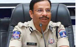
హైదరాబాద్, మే 16 (పద్మక్రాంతి):

మే 22న ఉప్పల్ వేదికగా జరగనున్న ఎస్ఆర్ఎస్, ఆర్పీబీ మ్యాచ్ కు ఉన్న క్రేజీస్ ను సైబర్ కేటుగాళ్లు తమకు అనుకూలంగా మలచుకుంటున్నట్లు సీపీ సజ్జనార్ హెచ్చరించారు. 'సోషల్ మీడియా వేదికగా టవీట్ లు పోస్టు చేయకుండా' అనేక ప్రకటనలు దర్యాప్తు చేపట్టారు. అధికారిక టిక్టింగ్ భాగస్వామి అయిన 'డిస్కెస్ట్' యాప్ ను పోలిన రంగులు, లోగోలతో ఉన్న నకిలీ యాప్ ను సృష్టించి, తక్కువ ధరకే టిక్టు ఇస్తామంటూ ఉరిపెట్టారు. ఫేక్ యాప్ తో తస్మాత్ జాగ్రత్త.