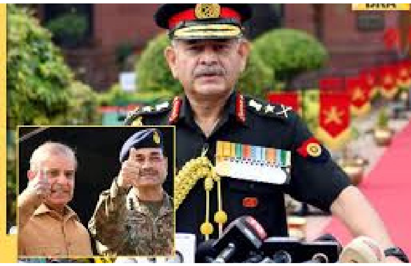
ఆపరేషన్ సిందూర్ చేపట్టడానికి దారి తీసిన విషయం తెలిసింది. పాక్ అక్రమిత కశ్మీర్ లో ఉన్న ఉగ్రవాదులను మళ్లీ పన్నే ఏం చేస్తారని ఆయన్ను ప్రశ్నించారు. జనరల్ ద్వితీయ తన వ్యాఖ్యల్లో పాకిస్తాన్ ను నేరుగా వార్నింగ్ ఇచ్చారు. ఉగ్రవాదానికి వ్యతిరేకంగా ఇండియా నిలుస్తుందన్నారు. గత ఏడాది మే 7న తేదీని పాక్ పై ఆపరేషన్ సిందూర్ చేపట్టిన విషయం తెలిసింది. పాక్ అక్రమిత కశ్మీర్ లో ఉన్న ఉగ్రవాదులను మోహరించారు. వివాదాస్పద ప్రదేశాల్లో అధికారులు బారికేడ్లు ఏర్పాటు చేశారు. సోషల్ మీడియాలో అభ్యంతరకరమైన కంటెంట్ ను వ్యాప్తి చేసే వారిపై కఠిన చర్యలు తీసుకుంటామని ధారా కఠింకర రాజీవ్ రంజన్ మానా హెచ్చరించారు.

మాట్లాడారు. పాకిస్తాన్ లోని ఉగ్ర స్థావరాల ఉనికిని 'ఆపరేషన్ సిందూర్' ద్వారా ప్రపంచానికి తెలియజేశాం. ఉగ్ర స్థావరాలకు సంబంధించిన ఆధారాలు అందజేశాం. పాకిస్తాన్ ఇప్పటికైనా తన తీరు మార్చుకోవాలి. ఆపరేషన్ సిందూర్ రిపోర్ట్ వెర్షన్ మరంత తీవ్ర స్థాయిలో ఉంటుంది. భారత్ ప్రభుత్వం ఎప్పుడూ దేశ పౌరుల రక్షణ, శ్రేయస్సు విషయంలో రాజీ పడదు. తన మార్గంలో ఎవరైనా అడ్డంకులు సృష్టించే దీటుగా స్పందిస్తుంది అని ద్వితీయ తేల్చి చెప్పారు. ఒకేకే పాకిస్తాన్ ఉగ్రవాదులను పోషించి, వాళ్లను ఇండియా మీదకు ఉసి గొల్పుతే, అప్పుడు ఆ దేశం ఈ భూమిద్ద ఉండాలా లేదా అన్న అంశాన్ని వాళ్లే నిర్ణయించుకోవాల్సి ఉంటుందన్నారు. చరిత్రలో ఆ దేశానికి స్థానం ఉండాలంటే ఉగ్రవాదులను పెంచి పోషించరాదన్నారు. మానేజ్మెంట్ సింబల్లో జరిగిన కార్యక్రమంలో ఆయన పాల్గొని మాట్లాడారు. ఒకేకే