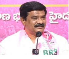
నిజామాబాద్, మే 16 (పద్మక్రాంతి):

ధాన్యం కొనుగోళ్లు, తరలింపులో కాంగ్రెస్ ప్రభుత్వం పూర్తిగా విఫల మయ్యిందని మాజీమంత్రి వేముల ప్రశాంతరెడ్డి విమర్శించారు. సిఎం రేవంత్ సమాక్షించినా పరిస్థితిలో మార్పు లేదన్నారు. మకులు, వరి ధన్యం కొనుగోలు చేసి, సకాలంలో తరలింపకపోవడంతో రైతులు నానా