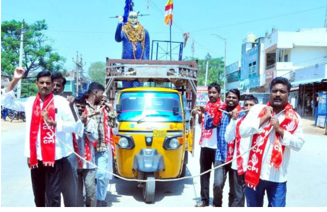
నిజామాబాద్, మే 16 (పద్మక్రాంతి):