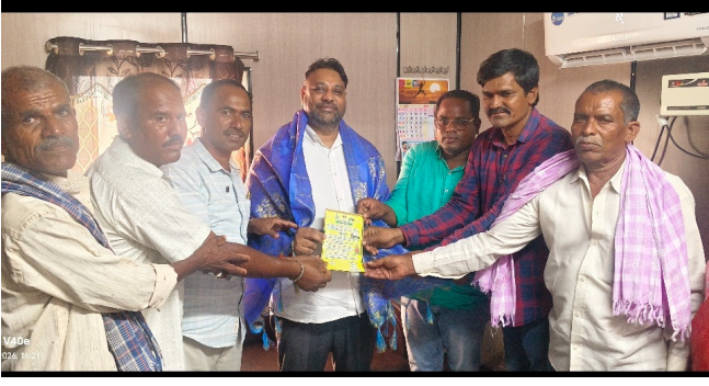
పద్మక్రాంతి, ఏప్రిల్ 13 (కల్వకుర్తి ప్రతినిధి):