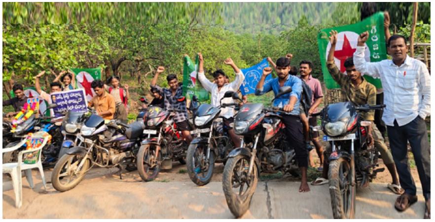
దళితులకు గిరిజనలకు ఇచ్చిన అధిక బిల్లులు తగ్గించాలని డిమాండ్ చేశారు. జిల్లా కలెక్టర్ ఆధ్వర్యంలో దళితులకు గిరిజనలకు సర్వేపట్టులో ప్రత్యేక గ్రీన్ ఫిల్డ్ ఏర్పాటు చేయాలని డిమాండ్ చేశారు. ఈ కార్యక్రమానికి వ్యవసాయ కార్మిక సంఘం జిల్లా సాయి

రెవెన్యూ పరిధిలో సర్వే నెంబర్ 41-లో 5-80 చెట్లు భూమిలో ఎన్టీఆర్ గృహ నిర్మాణ పథకం దళితులకు, గిరిజనలకు కేటాయించాలి బాదంపాడు రెవిన్యూ పరిధిలో సీలింగ్ భూమి చుట్టూ టౌండరీ ఏర్పాటు చేయాలని తెలిపారు. దళితులకు గిరిజనలకు పట్టణం ఇవ్వాలి. కొత్తకోట దళిత కాలనీకి మంచినీరు సౌకర్యం కల్పించాలి. గిరిజనలు సాగులో భూములకు, సాగు కల్పించి, గిరిజనలకు దళితులకు రక్షణ కల్పించాలన్నారు. జిల్లా కలెక్టర్ ఆధ్వర్యంలో మోనాటరింగ్ కమిటీలో గిరిజనలకు ప్రాతినిధ్యం కల్పించాలని, జైడ్ జోగంపేట పోలింగ్ కేంద్రం ఏర్పాటు చేయాలని కోరారు. సర్వేపట్టు నుండి జైడ్ జోగిపేట్ వరకు అప్రెస్ బస్సు సౌకర్యం కల్పించాలని,