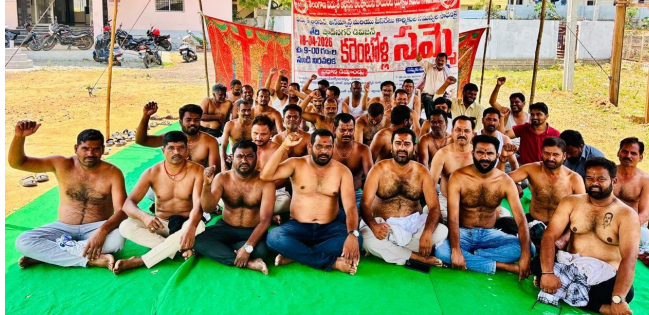
షాద్ నగర్ 16 ఏప్రిల్ పద్మక్రాంతి ప్రతినిధి