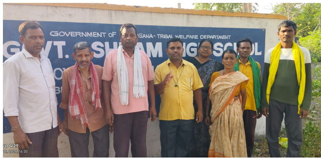
కామరం ఖీమ్ ఆసిఫాబాద్, ఏప్రిల్ 16, (పద్మక్రాంతి ప్రతినిధి):