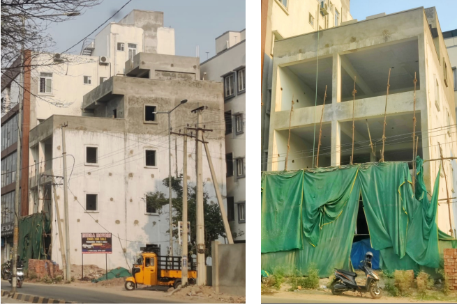
ఉప్పల్, ఏప్రిల్ 16 (పద్మక్రాంతి):

మల్లాజిరి మున్సిపల్ కార్పొరేషన్ ఉప్పల్ డివిజన్ పరిధిలోని ఉప్పల్ బాగాయాలో అక్రమ నిర్మాణాల జోరు కొనసాగుతుంది. ఉప్పల్ భగయత్ లోని ప్రధాన రహదారిలో ఇలాంటి సెట్ బ్యాక్ లేకుండా కమర్షియల్ పెటర్లు, పెంట్ హౌస్ తో ఇంటి నిర్మాణం యదేచ్ఛగా కొనసాగుతుంది. ఇట్టి నిర్మాణంపై గతంలో పలుమార్లు ఫిర్యాదులు వచ్చినప్పటికీ, అధికారుల చర్యలు మాత్రం శూన్యం, ఫిర్యాదులు చేసిన జోరుగా నిర్మాణం కొనసాగుతుండడంతో అధికారుల పనితీరుపై పలు అనుమానాలు వ్యక్తమవుతున్నాయి. ఇలాంటి అక్రమ నిర్మాణాలతో కోట్లాది రూపాయల ప్రభుత్వ ఆదాయానికి గండి పడుతుందని అధికారులు తక్షణమే స్పందించి అక్రమ నిర్మాణం పై చర్యలు తీసుకోవాలని స్థానిక ప్రజలు కోరుతున్నారు.