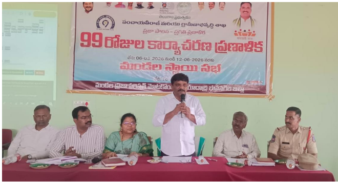
యాదాద్రి భువనగిరి, ఏప్రిల్ 16 (పద్మక్రాంతి):

ప్రభుత్వ సంక్షేమ పథకాలను క్షేత్రస్థాయిలోకి తీసుకెళ్లి, అర్హులైన ప్రతి ఒక్కరికీ న్యాయం చేయడమే లక్ష్యంగా ముందుకు సాగించే నల్గొండ-భువనగిరి-వరంగల్ పట్టణాధికారి శాసనసమంధం సభ్యులు డిప్యూటీ మజిలీస్ అధికారులకు, ప్రజాప్రతినిధులకు సూచించారు. గురువారం యాదాద్రి భువనగిరి జిల్లా మూటకొండూరు మండల కేంద్రంలో నిర్వహించిన ప్రజా పాలన - ప్రగతి ప్రణాళిక 99 రోజుల కార్యచరణలో భాగంగా మండల స్థాయి సమీక్షా సమావేశంలో ఆయన ముఖ్య అతిథిగా పాల్గొని మాట్లాడారు. మార్చి 6 నుండి జూన్ 12 వరకు కొనసాగే ఈ 99 రోజుల ప్రణాళికలో భాగంగా పారిశుధ్యం, విద్య, ఆరోగ్యం వంటి 10 కీలక రంగాల్లో మార్పు తీసుకురావాలని సూచించారు. ప్రభుత్వ యంత్రాంగం ప్రజలకు జవాబుదారీగా ఉండాలని, మండల స్థాయిలో పెండింగ్లో ఉన్న దరఖాస్తులను త్వరితగతిన పరిష్కరించాలని ఆదేశించారు. వార్డు మెంబర్లు, సర్పంచులు, ఇతర ప్రజాప్రతినిధులు ఈ ప్రణాళికలో మరుగ్గా పాల్గొని గ్రామాలను అభివృద్ధి పథంలో నడిపించాలని కోరారు.