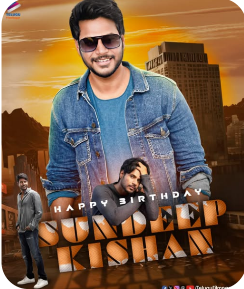
తెర పైకి వచ్చింది. దానిపై నా స్పష్టత రాకపోవడంతో... సందీప్ కిషన్ తో చేయనున్నారంటూ ఇటీవల ప్రచారం జరిగింది. ఎట్టకేలకు ఇప్పుడు అసౌన్ మెంట్ వచ్చింది.