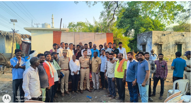
కొమరం భీమ్ ఆసిఫాబాద్, ఏప్రిల్ 16, (పద్మక్రాంతి ప్రతినిధి):