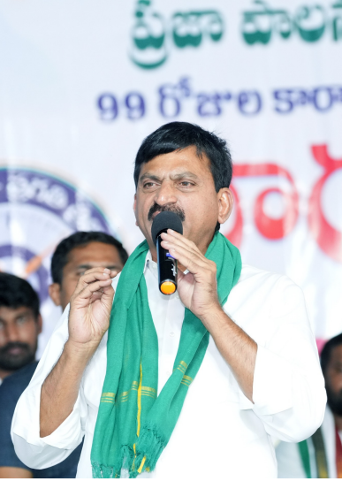
నా కుటుంబ సభ్యులు ఉన్నారని నిరూపించాలని సవాల్ చేస్తున్నా. వట్టి నాగులపల్లి భూముల్లోనూ హరీశ్ రావు హార్టిగా దుష్ప్రచారం చేస్తున్నారు. కుటుంబ సభ్యుల వివాదాన్ని కూడా ఈ ప్రభుత్వానికి అంటగట్టారని మంత్రి పాంగులేటి తెలిపారు.

నిర్మాణాలు ప్రారంభించారు. భూములు పొందిన వారు నాలా కన్వర్షన్ ఇవ్వలేదని 2022లోనే సుప్రీంకోర్టుకు వెళ్లారు. వాళ్లు కోర్టుకు వెళ్లే బిఆర్ఎస్ ప్రభుత్వం కనీసం కొంటర్ కూడా దాఖలు చేయలేదు. కాంగ్రెస్ ప్రభుత్వం వచ్చాక.. అవి ప్రభుత్వ భూములు అని చెప్పి మేం కొంటర్ వేశాం అని అన్నారు.. అనాడు వాటాల ఒప్పందం చేసుకుని భూములు కట్టబెట్టి ఇవాళ మా మీద నిందలు వేస్తున్నారు. నాదర్ గుల్ భూముల్లో వాటా రాకపోవడంతో హరీశ్ రావు ఇవాళ తెరపైకి తెచ్చారని మండిపడ్డారు. ప్రాపొలిటెడ్ భూముల్లో ఈ ప్రభుత్వం ఎలాంటి మార్పులు చేయలేదు. హరీశ్ రావు చెబుతున్న కంపెనీల్లో నా కుటుంబ సభ్యులెవరూ లేరు.