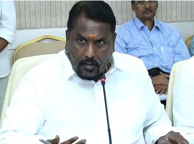
ప్రజాప్రతినిధులతో విస్తృతంగా చర్చించారు. గిరిజన, విజిల్స్ ప్రాంతాల్లో ప్రభుత్వం మౌలిక వసతుల కోసం నిధులు మంజూరు చేస్తున్నప్పటికీ, అమలు దశలో ఎదురవుతున్న అడ్డంకులపై మంత్రి ఆవేదన వ్యక్తం చేశారు. గిరిజనుల జీవన ప్రమాణాలను మెరుగు పర్చాలంటే శాఖల మధ్య సమన్వయం అత్యవసరమని స్పష్టం చేశారు. ముఖ్యమంత్రి రేవంత్ రెడ్డి గిరిజన సభ్యులపై ప్రత్యేక దృష్టి సారించిన శేషధర్మంలో, కేటాయించిన నిధులు లక్ష్యానికి చేరేలా అధికారులు కట్టుదిట్టంగా పర్యవేక్షణ చేపట్టాలని మంత్రి ఆదేశించారు. నిధులు ఉన్నా పనులు జరగకపోవడం