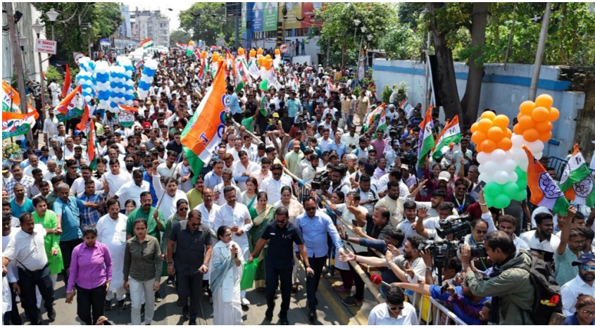
దీనికి వ్యతిరేకంగా మేం మళ్ళీ కోర్టును ఆశ్రయిస్తాం' అని అన్నారు. భవానీపూర్ నుంచి మమత మూడుసార్లు ఎమ్మెల్యేగా గెలిచారు. దీనికి కంఠకోటగా ఉన్న ఈ నియోజకవర్గం నుంచి భాజపా తన అభ్యర్థిగా సువేందు అధికారిని బరిలోకి దింపింది. ఇక, బెంగాల్ లో అసెంబ్లీ

పాల్గొన్నారు. అనంతరం ఆమె ఇక్కడ నామినేషన్ పత్రాలను సమర్పించారు. ఆ తర్వాత ఆమె విలేజ్ కులలో మాట్లాడుతూ.. 'నేను పుట్టింది, పెరిగింది భవానీపూర్ లోనే. నా జీవితంలో అంతా ఇక్కడినుంచే మొదలైంది' అని వ్యాఖ్యానించారు. మొత్తం 294 స్థానాల్లోనూ టీఎన్ఎ అభ్యర్థులను గెలిపించాలని ఈ సందర్భంగా ఆమె ప్రజలను కోరారు. ఓటరు జాబితా ప్రత్యేక ముమ్మర సవరణ (సర్)లో భాగంగా.. పలువురి పేర్లను ఓటరు జాబితా నుంచి తొలగించడంపై మమత ఆందోళన వ్యక్తం చేశారు. 'ఓటర్ల జాబితా నుంచి అనేకమంది పేర్లను తొలగించడం నాకు చాలా బాధ కలిగిస్తోంది. ఓటరు తుది జాబితా ఇంకా ఎందుకు విడుదల చేయలేదో నాకు అర్థంకావడం లేదు.