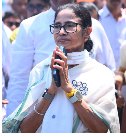
ఎన్నికలు ఏప్రిల్ 23, 29న రెండు విడతలుగా జరగనున్నాయి. మే 4న ఓట్ల లెక్కింపు ఉండనుంది.