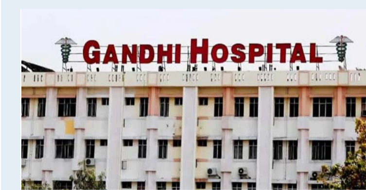
హైదరాబాద్ : ఉస్మానియా, గాంధీ వంటి ప్రభుత్వ ఆసుపత్రులలో ప్రవాస తెలుగు వైద్య నిపుణుల సేవలను ప్రవేశపెట్టేందుకు తెలంగాణ ప్రభుత్వం వినూత్న ప్రణాళికను నిర్ణయం చేసింది. ముఖ్యమంత్రి రేవంత్ రెడ్డి ఆదేశాల మేరకు.. విదేశీ వైద్యులను సమన్వయం చేసేందుకు ఒక ప్రత్యేక వెబ్ సైటును కెంద్ర ఆరోగ్య శాఖ రూపొందిస్తోంది. దీని ద్వారా విదేశాల నుండి వచ్చే నిపుణులు కచ్చితంగా వైద్య సేవలు అందించడానికి ఏలు కలుగుతుంది. రాష్ట్రంలో వైద్యారోగ్యశాఖను పటిష్టం చేయటమే కాకుండా.. పేదలకు అంతర్జాతీయ స్థాయి చికిత్సను అందుబాటులోకి తీసుకొస్తుంది. పేదరోగులకు నిజంగా ఇది తీపి కబురే. ప్రభుత్వ ఆసుపత్రుల్లో కార్పొరేట్ వైద్యం అందనుంది. వైద్యారోగ్య శాఖలో విప్లవాత్మక మార్పులకు త్రీకారం చుడుతూ.. విదేశాల్లో స్థిరపడిన ప్రవాస తెలుగు వైద్య నిపుణుల సేవలను ప్రభుత్వ ఆసుపత్రులలోనే పేదలకు అందుబాటులోకి తీసుకురావాలని సీఎం రేవంత్ రెడ్డి నిర్ణయించారు. ఈ మేరకు ఉస్మానియా, గాంధీ, నిలోఫర్, ఎంఎన్ఆర్ క్యాన్సర్ ఆసుపత్రులలో త్వరలో విదేశీ వైద్య నిపుణుల సేవలు అందుబాటులోకి రానున్నాయి. ప్రవాస భారతీయులైన నిపుణుల వైపువ్యాన్ని ఇక్కడి పేద రోగులకు ఉచితంగా అందించడమే లక్ష్యంగా వైద్య ఆరోగ్య శాఖ వేగంగా అడుగులు వేస్తోంది. ఇందుకోసం ఒక ప్రత్యేక వెబ్ సైటును రూపొందిస్తూ.. విదేశీ వైద్యులను సమన్వయం చేసేందుకు ప్రత్యేక కార్యచరణను సిద్ధం చేసింది. చాలామంది విదేశీ డాక్టర్లకు తమ మాతృభూమికి సేవ చేయాలనే తపన ఉన్నప్పటికీ, సరైన వేదిక లేక వెనుకంజ వేస్తున్నారు. దీనిని దృష్టిలో ఉంచుకుని ప్రభుత్వం ఒక కేంద్రీకృత వెబ్ సైటును అందుబాటులోకి తెస్తోంది. ఈ పోర్టల్ ద్వారా వైద్యులు తమ స్పెషలైజేషన్, వారు హైదరాబాద్ లో అందుబాటులో ఉండే రోజులు, కేటాయింపగలిగే సమయాన్ని సమాధానం చేసుకోవచ్చు. వ్యక్తిగత కారణాలతో లేదా వైద్య సదున్నుల కోసం హైదరాబాద్ వచ్చే నిపుణులు, తమ విరామ సమయంలో కొన్ని రోజుల పాటు ప్రభుత్వ ఆసుపత్రుల్లో శస్త్రచికిత్సలు నిర్వహించడం లేదా వైద్య విద్యార్థులకు గెస్ట్ ఫ్యాకల్టీగా బోధించడం వంటి సేవలు అందించవచ్చు. హైదరాబాద్ ఇప్పటికే అంతర్జాతీయ స్థాయి వైద్య సేవలకు కేంద్రంగా మారింది. విదేశాలలో పోలిస్సీ ఇక్కడ వైద్య ఖర్చులు తక్కువగా ఉండటం, అత్యధునిక సాంకేతికత అందుబాటులో ఉండటంతో విదేశీ రోగులు కూడా హైదరాబాద్ వైపు మొగ్గు చూపుతున్నారు. ఇప్పుడు ప్రభుత్వ ఆసుపత్రుల్లో కూడా అంతర్జాతీయ నిపుణులు సేవలు అందించడం ద్వారా, ప్రభుత్వ రంగంలో వైద్య ప్రమాణాలు మరింత మెరుగుపడతాయి. గతంలో విదేశాల్లో పనిచేసిన అనేక మంది నిపుణులు ప్రస్తుతం ఇక్కడి కార్పొరేట్ ఆసుపత్రుల్లో సేవలందిస్తున్నారు. వారి అనుభవాన్ని ఇప్పుడు ప్రభుత్వ ఆసుపత్రుల్లో కొనసాగించటం ద్వారా పేదలకు కార్పొరేట్ స్థాయి వైద్యం ఉచితంగా దక్కుతుంది. ఈ మేరకు రేవంత్ సర్కార్ ప్రత్యేక కార్యచరణ రూపొందిస్తుంది. ఈ నిర్ణయాలు అమలులోకి వస్తే పేద రోగులకు కార్పొరేట్ స్థాయి వైద్యం రూపాయి ఖర్చు లేకుండా అందుతుంది. ఇక హైదరాబాద్ నగరంలో కొత్త మెడికల్ కాలేజీ ఏర్పాటైంది. ఎల్సినగర్ కు మెడికల్ కాలేజీ కేటాయిస్తూ మంత్రి దామోదర రాజనర్సింహా కీలక ప్రకటన చేశారు. ఇప్పటి వరకు మహేశ్వర్ పేరుతో మెడికల్ కాలేజీగా ఉండగా.. ఇక నుంచి ఎల్సినగర్ కు కేటాయిస్తున్నట్లు వెప్పారు.