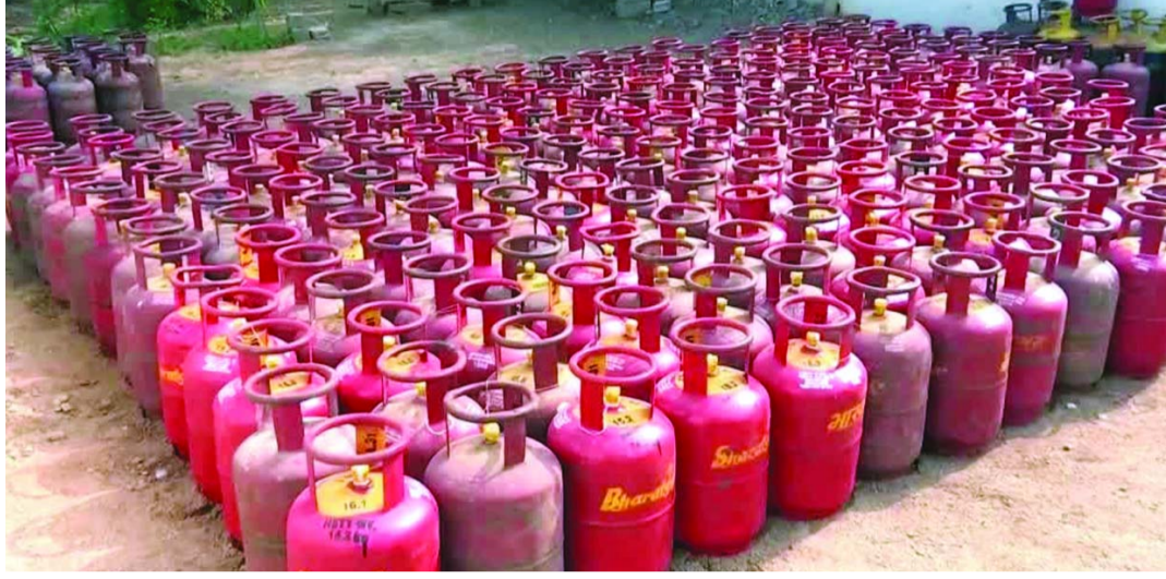
అప్పుడప్పుడు తనిఖీలు చేస్తున్నామని చెప్పినా, వాటి ప్రభావం మాత్రం కనిపించడం లేదు.

ఏజెన్సీలు నిర్లక్ష్యం - అధికారుల అలసత్వం : నగరంలోని కొన్ని గ్యాస్ ఏజెన్సీలకు పరిమితికి మించి కనెక్షన్లు ఉన్నాయని, వాటి నిర్వహణలో లోపాలు ఉన్నాయని స్వయంగా పౌర సరఫరా శాఖ ఎన్ఫోర్స్మెంట్ అధికారులు అంగీకరిస్తున్నారు. వినియోగదారుల నుంచి ఫిర్యాదులు అధికంగా వస్తున్నప్పటికీ, అయా ఏజెన్సీలపై కఠిన చర్యలు తీసుకోవడంలో అధికారులు వెనుకదాగు చేస్తున్నారు.