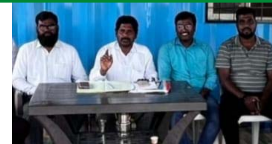
లెక్కచేయకుండా కూడా త్యాగం చేశారనీ, ఇది ఉద్యమానికి పెద్ద ప్రేరణగా నిలిచిందన్నారు. కాంగ్రెస్ ప్రభుత్వానికి చిత్తశుద్ధి ఉంటే ఉద్యమకారుల సంక్షేమాన్ని పట్టించుకోవాలని ఉద్యమంలో పాల్గొన్న జర్నలిస్టులకు ప్రత్యేక చోదా కల్పించాలని వారు ప్రభుత్వాన్ని డిమాండ్ చేశారు. ప్రభుత్వం ఉద్యమకారులకు ఇచ్చిన హామీలను నెరవేర్చకపోతే ప్రత్యక్ష కార్యచరణ ప్రచారణకు రూపొందించడం ఖాయమని హెచ్చరించారు.