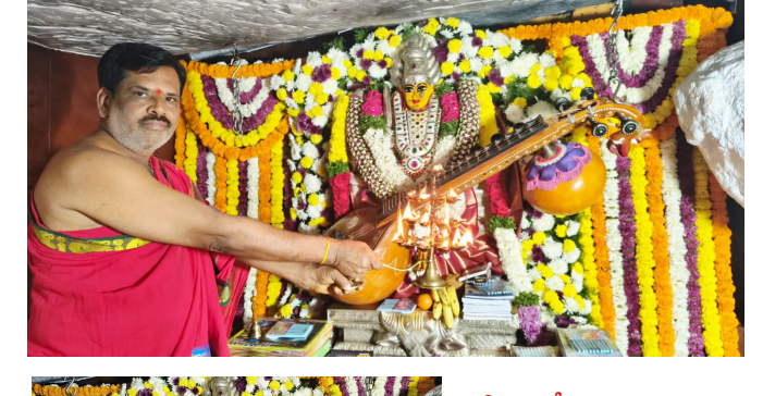
పాపన్నపేట, జనవరి 23 (పద్మక్రాంతి)

ప్రసిద్ధ పుణ్యక్షేత్రం మెదక్ జిల్లా ఏడుపాయల వనదుర్గమ్మ ఆలయం. శుక్రవారం (శ్రీ పంచమి) వసంత పంచమిని పురస్కరించుకొని వనదుర్గమ్మ..సరస్వతీ మాత గా భక్తులకు దర్శనమిచ్చింది. అర్చకులు అమ్మవారిని పుస్తకాలు, పెన్నులు,వీణ, వివిధ రకాల పుష్పాలతో రూపంలో సుందరంగా అలంకరించి, విశేష పూజలు నిర్వహించారు