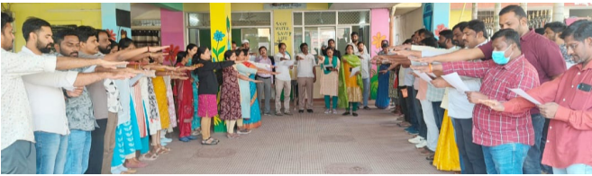
భోడుప్పల్,జనవరి 23 (పద్మక్రాంతి):

భోడుప్పల్ సర్కిల్ కార్యాలయంలో 16వ జాతీయ ఓటర్ దినోత్సవం