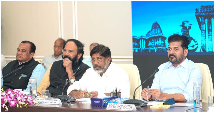
కేంద్రం నుండి అనుమతి తెచ్చామని, హైదరాబాద్-బెంగళూరు మధ్య కనెక్టివిటీని పెంచి అభివృద్ధిని సాధించేందుకు సిఎం రేవంత్ ప్రకటించారు.